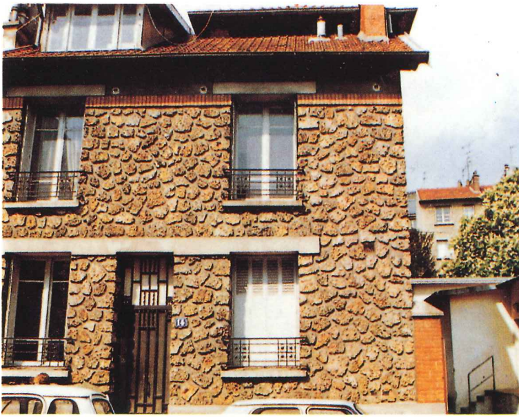
"Maison de la Police", 14, rue de Vergennes 78000 Versailles. 14 fonctionnaires avec priorité aux collègues féminines.